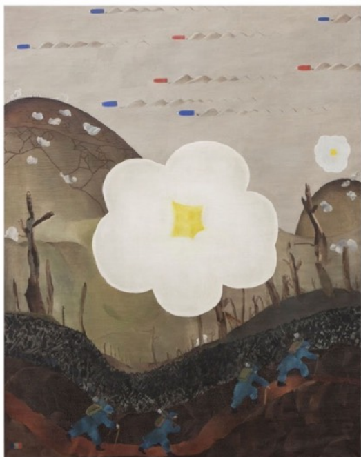
Per Krohg: Granaten (1916)

modernistisk vis er opptatt av formale problemer - selv om de også er viktige for ham - men i særlig grad har tatt opp eksistensielle spørsmål, ofte aktualisert gjennom hendelser og begivenheter i hans egen samtid. Han var f. eks. en av de første til å reflektere malerisk over Utøya-massakren. Han har ofte latt seg inspirere av litteratur, som Henrik Ibsen og Thomas Mann, og av musikk. Derfor er han en kunstner som egner seg godt på en festival med tittelen "I skyggen av en krig". Men vi skal også ha en egen utstilling med bilder laget som reaksjoner på første verdenskrig - riktignok ikke originaler, men gode kopier - som ett av de mest rystende krigsbilder fra 1. verdenskrig, nemlig Otto Dix Krigen (1932) og Per Krohgs Granaten (1916). Sammen vil disse utstillingene bli et akkompagnement til den musikken som skal fremføres, et akkompagnement som forhåpentlig vil fremme refleksjon og fordypelse.